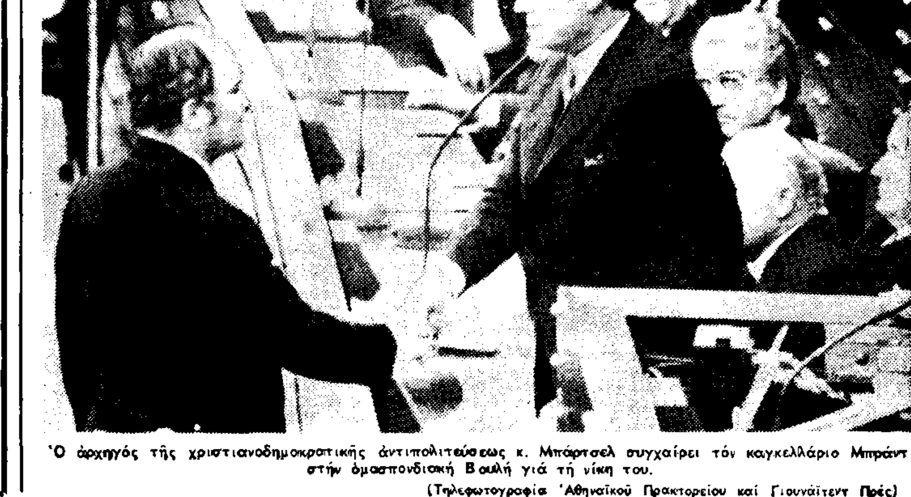
Τό άρχηγός τής χριστιανοδημοκρατικής άντιπολιτευσεσ κ. Μπάρτσελ συζητεί τόν καγκελάριο Μπράντ στήν δημοκρατική Βουλή για τήν νίκη του.